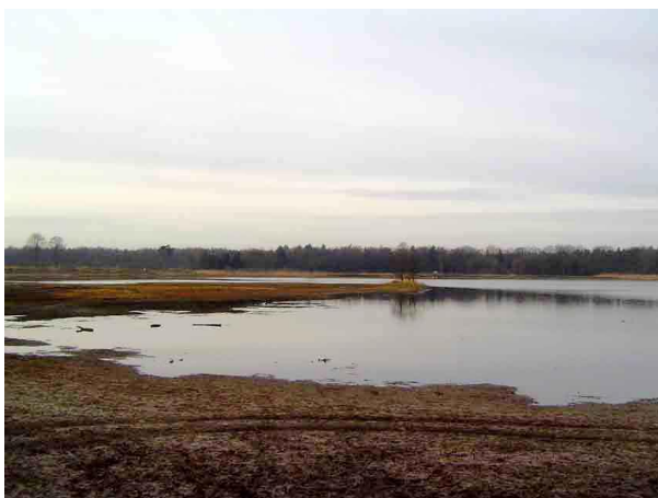
Groot Meer januari 2004