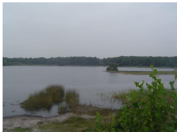
Groot Meer september 2008